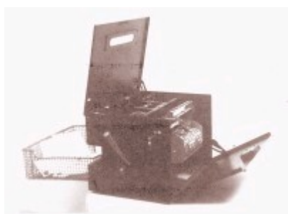
La machine type "POKO"

Pendant quelques temps, la maison Slooper eut le monopole des perforations, puis de nombreuses autres sociétés se mirent à en fabriquer. Ces machines sont aussi très difficiles à recenser. Il existe des machines de 1 à 10 poinçons, mais selon la manière dont le timbre a été placé sous l'emporte-pièce, la perforation occupera 8 positions possibles au maximum.